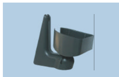
Stand da parete